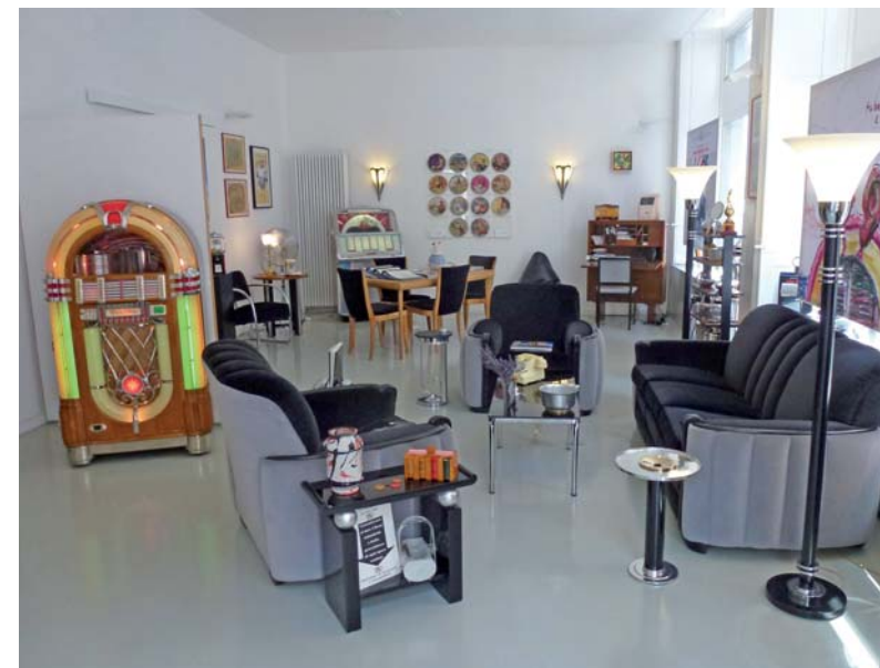
In alto da sinistra, la galleria Sperone Westwater; una delle sale della galleria Canesso, la galleria De Primi Fine art e la galleria Fotografica Fine Art