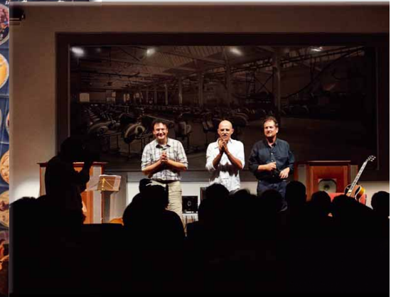
Die originale Besetzung des „La-Notte“-Albums auf der Bühne – eines der zahlreichen Konzerte